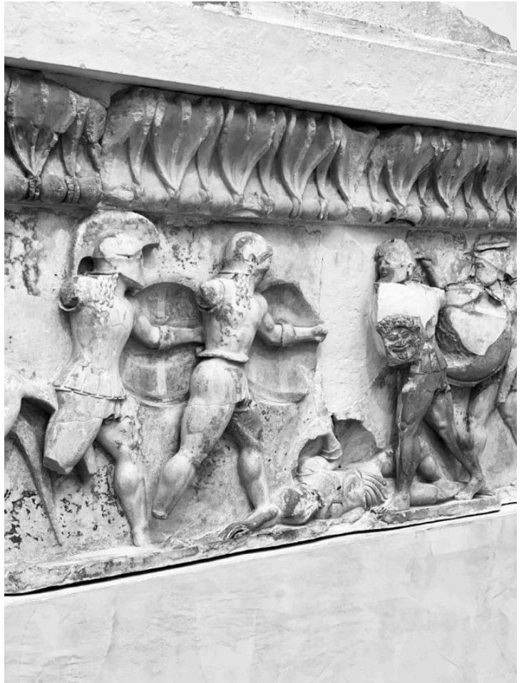
Bitva u Helmova žlebu