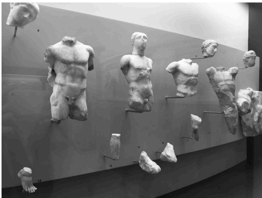
Po bitvě u Helmova žlebu